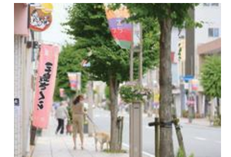
三島大通り商店街 →MAP 11

■三島市民生涯学習センター 料理講習室 三島市大宮町 1-8-38 ☎055-983-0888