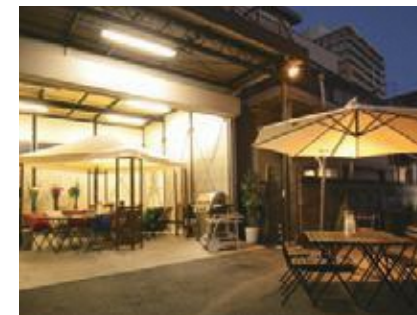
Shizuoka BBQ Terrace 三島広小路ウェアハウス →MAP 10

■伊豆フルーツパーク ※完全予約制 三島市塚原新田 181-1 ☎055-971-1151 営業時間：8:30-19:30 定休日：年中無休