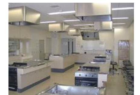
三島市民生涯学習センター →MAP 11

2日目 09:00 農家で収穫体験 11:30 買い出し~調理~昼食 場所：三島市民生涯学習センター 講師：みしまタニタ健康くらぶ ヘルスコンシェルジュ 14:30 三嶋大社 正式参拝ツアー 15:30 まちあるき 17:00 三島駅発 帰宅