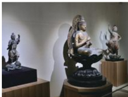
佐野美術館 →MAP 7

刀剣・人形・絵画・絵本など、多彩な内容の展示会を年に7~8回開催しています。美術館のあとは国の登録有形文化財の庭園「隆泉苑」を散策するのもおすすめ。