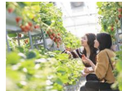
伊豆フルーツパーク →MAP 9

タニタから直接指導を受けたヘルスコンシェルジュを講師に迎え、箱根西麓三島野菜をふんだんに使った料理を作ってみませんか? ■お問い合わせ先：三島市健康づくり課 ☎055-973-3700