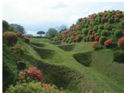
山中城跡 →MAP 6

する旅人たちの休息地として賑わいを見せました。人の行き交いとくく様々な文化も行き交ったのでしょう。このプランでは、三島の歴史や文化に触れ、新たな三島を発見することができるコースをご紹介します。