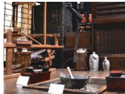
三島市郷土資料館 →MAP 8

■佐野美術館 三島市中田町 1-43 ☎055-975-7278 開館時間：10:00-17:00 休館日：木曜日(祝日の場合は開館)、年末年始、展示替期間など