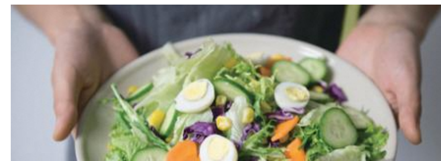
みしまタニタ健康くらぶ ヘルスコンシェルジュ

の調理では、みしまタニタ健康くらぶヘルスコンシェルジュを講師に招き、三島の食材をふんだんに使った美味しく健康なメニューを作ってみましょう。まちあるきの時間もたっぷり、三島の美味しいところをまるごと体験できるプランです。