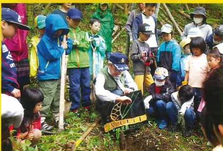
興津川保全市民会議によるタケノコ掘り(静岡市)