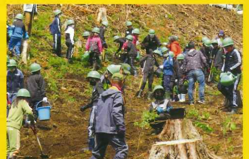
北郷創林隊と緑の少年団による植樹(小山町)