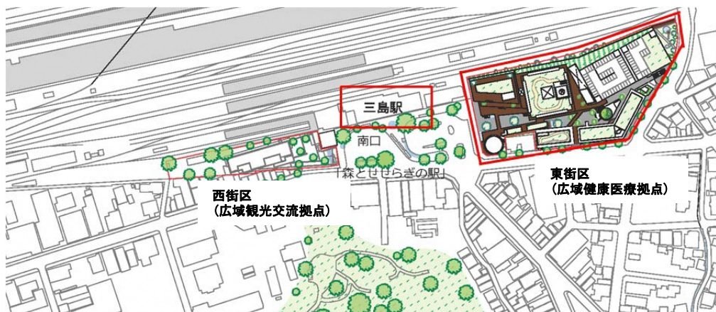
三島駅前の位置関係