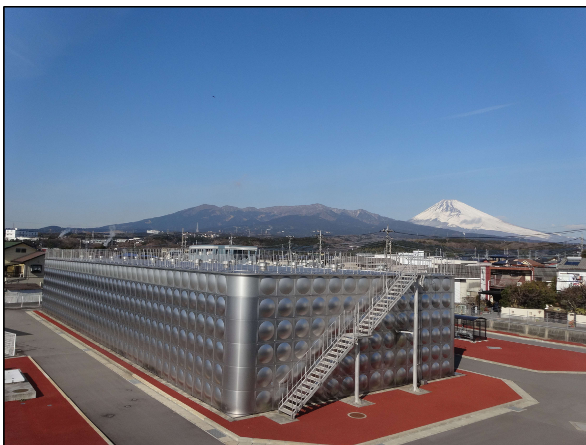
伊豆島田浄水場と富士山