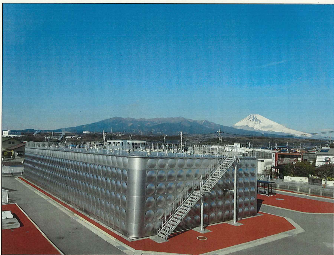
伊豆島田浄水場と富士山