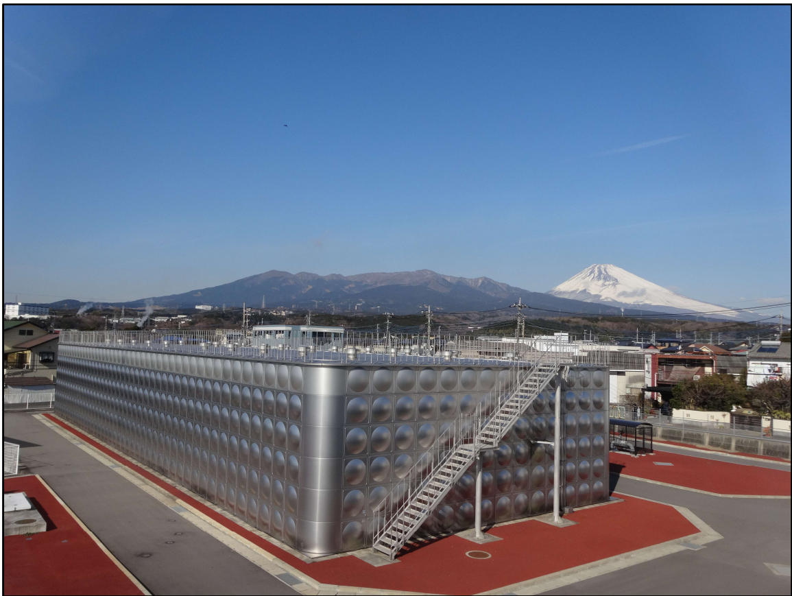
伊豆島田浄水場と富士山