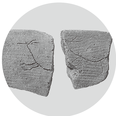
跳躍するシカを見事に表現した絵画土器 (浜松市角江遺跡出土)