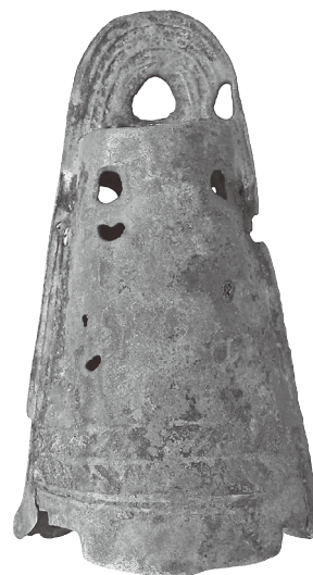
当時の輝きを残す小銅鐸 (三島市青木原遺跡出土)