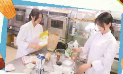
グルテンフリーのお菓子の製造