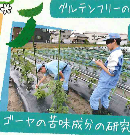
ゴーヤの苦味成分の研究