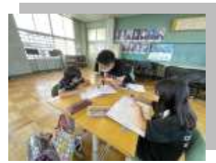
学生学習支援員の感想→