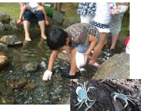
★サワガニお持ち帰りOK!