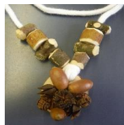
★木の葉などでクラフト