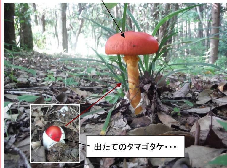
出たてのタマゴタケ・・・