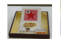
ペットでポイントラリー