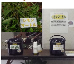
今秋「レモンマートルと蜂蜜」のハーブティです。