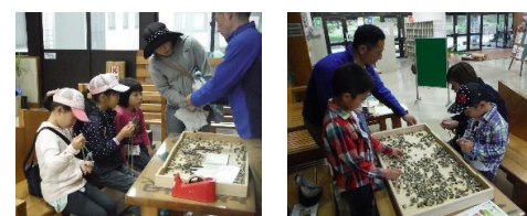
木のピースクラフト

5月13日の日曜日に「箱根の里オープンデー」を開催しました。当日は、雨、霧の中97名の方が来場、プラネタリウム観賞、木のクラフト、室内でのポイントラリー、ハーブのお風呂にハーブティなどを体験していただきました。