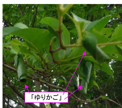
＜エゴツルクビオトシブミ＞

オトシブミの仲間は、一枚の木の葉などに切り込みをいれクルクル巻きながら中に卵を一つ産み付けできた物を「ゆりかご」といいます。 幼虫はこの巻かれた葉を食べて成長して成体になります。 ※写真はエゴツルクビオトシブミのゆりかごです。