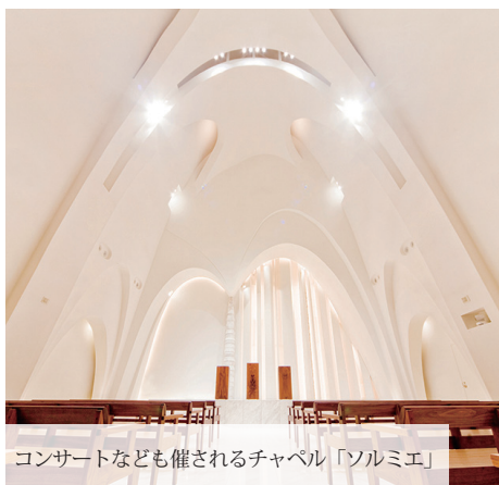
コンサートなども催されるチャペル「ソルミエ」

三島には年に3回の歩行者天国があり、この日にあわせて、ホテルで「0歳からのコンサート」を開催しています。ぐずぐずいるお子様も演奏が始まると静かになります。途中で騒ぎ始めても後方のスペース