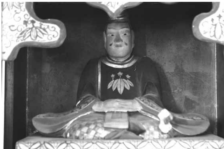
源頼朝木像／宗徳院蔵

今回の企画展では市制施行 75 周年と伊豆の国市との「歴史・文化交流及び協力に関する協定」締結 1 周年を記念して、郷土ゆかりの偉人、源頼朝に関わる史跡や伝承をご紹介します。