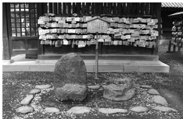
頼朝・政子腰掛石／三嶋大社境内