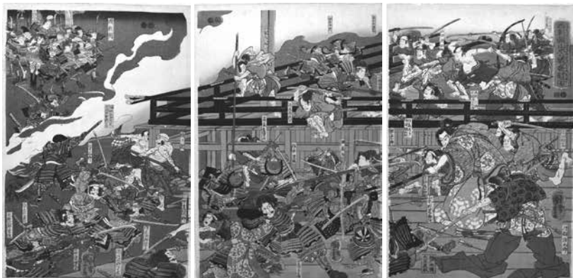
浮世絵「源頼朝山木館夜討図」