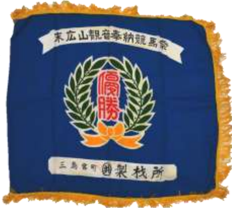
末広山競馬祭 優勝旗(昭和16年頃)

平成27～29年度の間、市民の皆さまから数多くの貴重な歴史・民俗・美術資料のご寄贈をいただきました。また、市場に出ている資料から、三島に関わる歴史資料を数点購入し収蔵品に加えました。本展ではこれら三島市郷土資料館に集まってきた様々な資料を展示紹介することにより、三島及び北伊豆地域の特色ある歴史と、ここ一世紀あまりの間に急激に変化していった産業や庶民の生活をふり返ります。