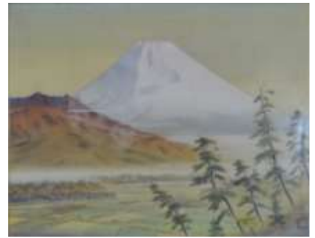
下田舜堂画伯の「富士山」(日本画)