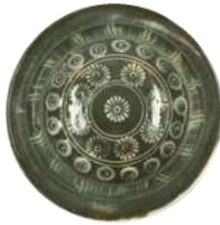
三島茶碗(現代作家の作品)