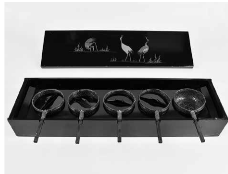
茶屋で使われていた仕器 (もてなしに使われたソバざるか)