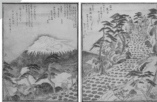
東街便覧図略 富士見平 寛政7年(1795) 名古屋博物館蔵 (パネル展示)