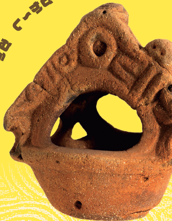
観音洞B遺跡出土吊手土器(縄文時代)