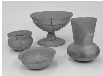
金沢遺跡9号住居跡出土土器(古墳時代)