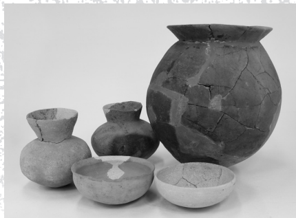
金沢遺跡8号住居跡出土土器(古墳時代)