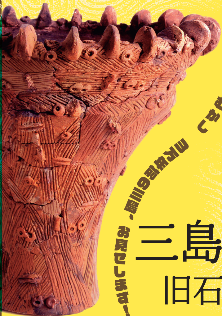
陰洞B遺跡出土土器(縄文時代)