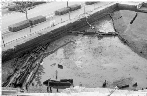
西大久保遺跡水田跡(弥生時代)