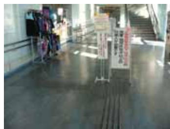
(フロアマットや商品など、誘導経路上の障害物の除去等)