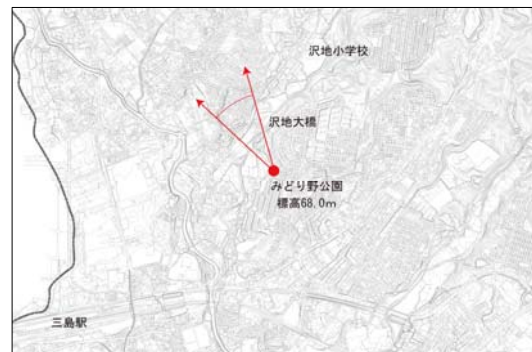
■東壺町田みどり野公園付近から見た富士山