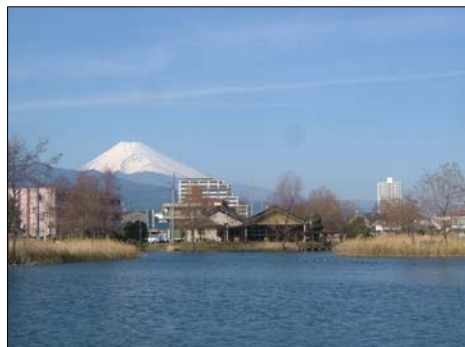
■中郷温水池南端から見た富士山