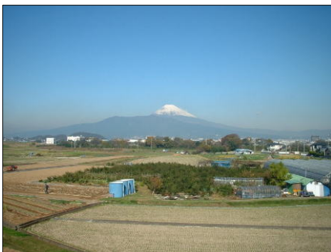
■新城橋付近から見た富士山