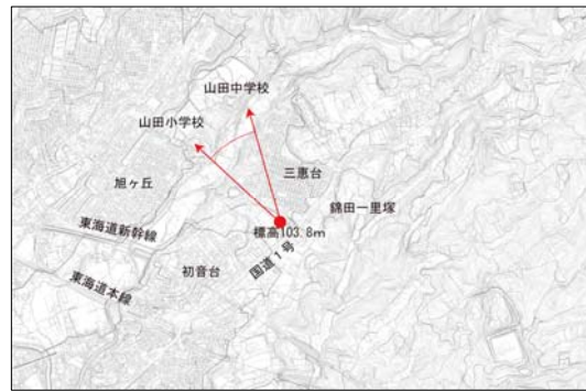
■初音ヶ原（錦田一里塚下）の広場から見た富士山