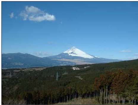
■西櫓付近から見た富士山