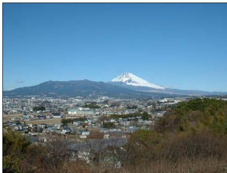
■前面道路から見た富士山