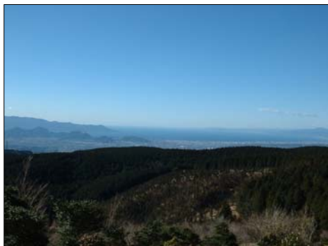
■施行平から見た市街地と駿河湾