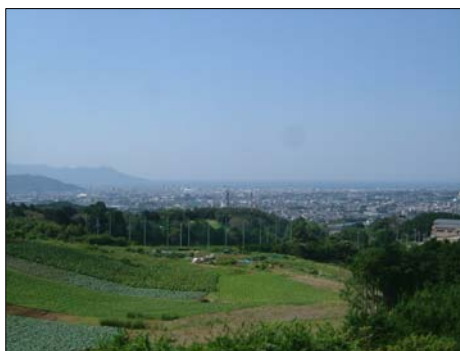
■末広山から見た市街地と駿河湾