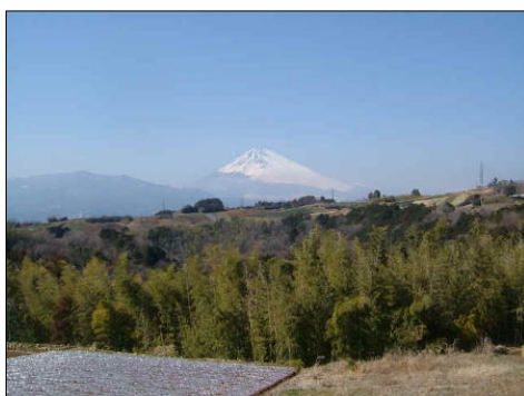
■坂公民館北側から見た富士山