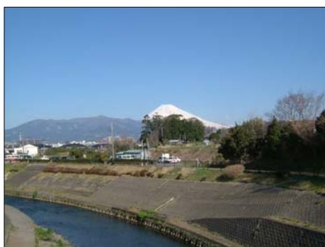
■新町橋から見た富士山