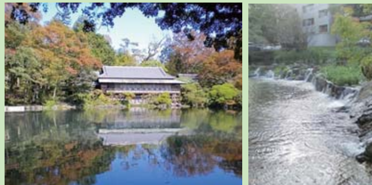
左／楽寿館と小浜池 上／白滝公園の湧水

富士山に降った雨が伏流水となり、市内に自噴し、せせらぎとなる。清らかな水の流れは三島の人々の信仰心と深く関わってきた。三島市街地には水神を祀る社や祠、灯笼流し会場の白滝公園などの建造物が残されており、良好な環境を形成している。