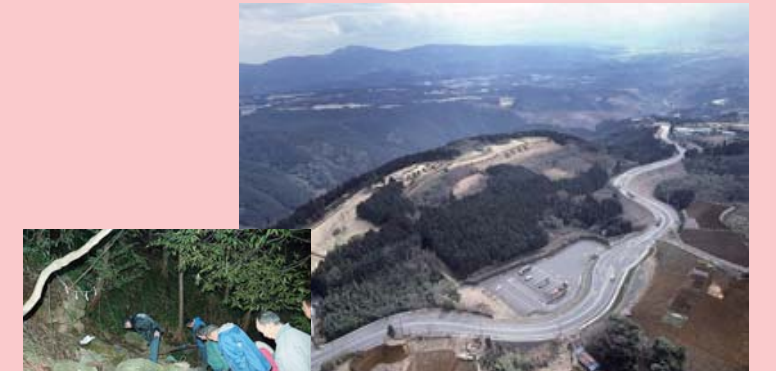
左：水神講／上：山中城跡

箱根西麓にある五つの坂の集落では、各集落の氏神である神社において集落成立当時から続く祭礼や水神講などの活動が今なお続いている。また、山中城跡は、地域の誇りとして、集落の人々により維持・管理活動が行われており、三島固有の良好な環境を形成している。